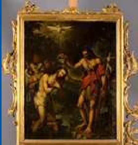
Bautismo de Cristo. Joaquín Campos, 1806. Parroquia de San Juan Bautista. Murcia.

Seguendo los relatos evangélicos el arte cristiano ha ofrecido multitud de representaciones del Bautismo del Señor. La escena transcurre teniendo como protagonistas a Jesús y Juan el Bautista, en el momento en el que el Espíritu Santo en forma de paloma desciende sobre el Hijo de Dios. Es sorprendente encontrar la figura de Cristo desnuda y de rodillas en el instante en el que se presenta ante el pueblo de Israel para iniciar su predicación. Aquel que ha de ser escuchado en la grandeza de su palabra se abaja y se muestra humilde. La imagen parece así interpelar al espectador que ha de convertir su corazón desde la humildad para acoger la buena noticia del Evangelio. Pero todo misterio de Cristo trasciende la vida de los hombres, siendo también los ángeles partícipes del extraordinario acontecimiento, que asisten reverentes al momento en que su Dios se postra para recibir el bautismo.