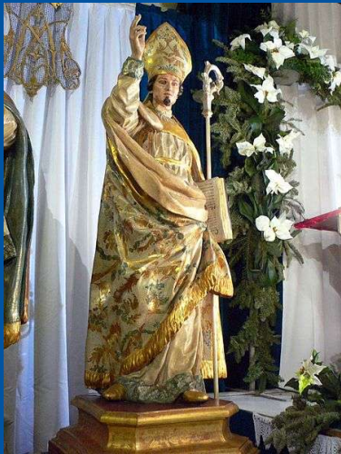
Francisco Salzillo. 1755 Parroquia de Santa María de Gracia. Cartagena.

A finales del siglo XVI el Obispo Sancho Dávila impulsó la devoción a San Fulgencio en toda el Obispado al traer desde Berzocana a la Catedral de Murcia parte de sus reliquias, erigir el Seminario Conciliar bajo su titularidad y nombrarlo patrono de la Diócesis de Cartagena. Desde entonces la iconografía del que fuera obispo de Cartagena en el siglo VII ha tenido abundante cabida en las artes plásticas, pero sin lugar a dudas es la escultura de Francisco Salzillo de la iglesia de Santa María de Gracia de Cartagena la más significativa de todas sus representaciones. Formando parte del grupo de las imágenes de los cuatro hermanos, San Fulgencio se distingue por alzar el brazo derecho en actitud de bendecir y vestir alba en vez de roquete, mostrando así que ejerce la titularidad episcopal en la Diócesis frente a sus hermanos Leandro e Isidoro. Con la mano izquierda recoge la capa pluvial para facilitar el paso que emprende avanzando la pierna, queriendo emprender el caminar de la fe al frente de su pueblo, que como pastor preside y encabeza. Porta la mitra y el báculo por su condición episcopal.