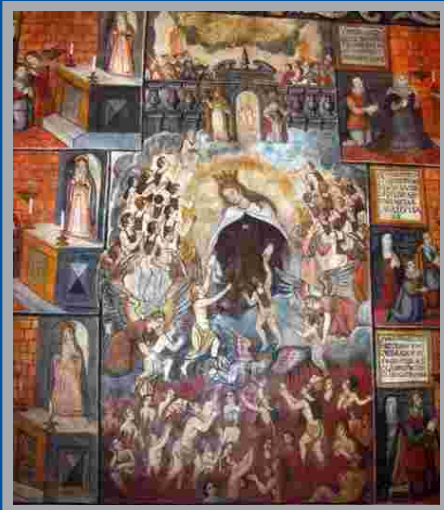
Virgen del Carmen. Juan Ibáñez. s. XVII. Santuario de La Santa (Santa Eulalia). Totana.

Ubicado en un enclave natural privilegiado, el Santuario de La Santa de Totana ofrece al peregrino y visitante, entre su rico patrimonio artístico, un extraordinario conjunto de pinturas murales de diferente temática iconográfica. La parte central de la pared del coro está decorada al templo con la representación de la Virgen del Carmen rescatando las almas del Purgatorio, escena de evidente carácter narrativo. María viste el hábito carmelitano y constituye el centro de la composición tendiendo sus manos hacia el Purgatorio en donde espera una multitud de creyentes, mientras otros tantos, que portan el escapulario, suben ayudados por los ángeles al cielo para ser recibidos a sus puertas por San Pedro y San Pablo. La devoción al escapulario es por tanto motivo de salvación, pero esta devoción tiene su razón de ser en el amor a María: vestir el escapulario es revestirse de María, engalanarse de su fe y de sus virtudes, garantía segura de salvación para aquellos que se purifican esperando la vida eterna.