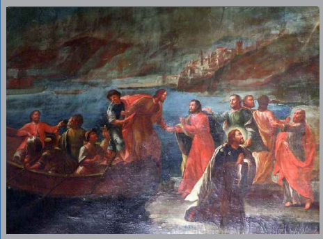
Desembarco de Santiago en Cartagena. Detalle del retablo del oratorio de los Obispos de Cartagena. Juan Navarro Muñoz. S. XVIII. Palacio Episcopal de Murcia.