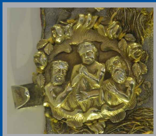
Carlos Zaradatti. 1786. Museo de la Catedral de Murcia.

La Conmemoración de los fieles difuntos marca la piedad del pueblo cristiano durante todo el mes de noviembre. Son abundantes las representaciones de escenas del Purgatorio, siendo el caso de este broche de paño de hombros uno de los ejemplos más bellos de la Catedral. Su colocación en una prenda litúrgica destinada al contacto con la custodia lo vincula estrechamente con el Misterio de la Eucaristía. La Catedral de Murcia, al igual que la mayoría de parroquias, contó con la presencia de una Cofradía del Santísimo y Ánimas, cuyos hermanos procuraban la adoración eucarística y ofrecía su oración por los difuntos. En este broche las almas, figuras que sin ropa se purifican en el fuego, parecen recordarnos que desnudos salimos del vientre de nuestra madre y desnudos volvemos a él. La Eucaristía es el sacrificio perpetuo de Cristo, que entrega su cuerpo resucitado por vivos y difuntos, y unimos a él, como nos recuerda la Escritura, es acción noble y justa que mira a la resurrección, porque si no creyéramos en ella sería inútil rezar por los que han muerto. Este broche de ánimas que cierra un paño de hombros eucarístico es signo profundo de lo que pretendían aquellas cofradías y siempre ha vivido la Iglesia: encomendar nuestros difuntos al único sacrificio que salva, el de Cristo.