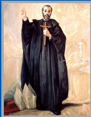
San Juan de Ávila. Manuel Muñoz Barberán, 1959. Seminario Conciliar de San Fulgencio de Murcia.

El cuadro de San Juan de Ávila que el artista lorquino Manuel Muñoz Barberán pintó en 1959 para la capilla del Seminario Conciliar de San Fulgencio es una de las más logradas obras de la iconografía del patrón del clero secular español. El llamado Maestro Ávila aparece con la tradicional fisonomía de su retrato, y levanta la mano derecha queriendo llamar la atención en su predicación, rasgo que le mereció el reconocimiento en la España del siglo XVI y su influencia en la creación de los seminarios para clérigos. Contemplado durante años por quienes se preparaban para el ministerio sacerdotal, es interesante comprobar cómo sujeta el crucifijo apretándolo contra el pecho, queriendo subrayar que no es posible hablar de Dios si antes no lo llevamos prendido en nuestro corazón. La austera y sobria indumentaria clerical se recorta sobre un fondo de ángeles que parece recordar cuál ha de ser la vida del sacerdote, que como él mismo dijera "tenga virtudes más que de hombres y ponga admiración a los que lo vieren: hombres celestiales o ángeles terrenales; y aún, si pudiere ser, mejor que ellos, pues tienen oficio más alto que ellos".