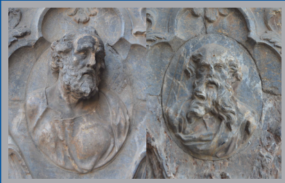
Relieves de San Pedro y San Pablo. S. XVIII. Jaime Bort. Imafrente de la Catedral de Murcia.

En cada una de las tres puertas de acceso a la Catedral de Murcia encontramos las esculturas de San Pedro y San Pablo, siguiendo la multiseccular tradición del arte cristiano de colocar a los príncipes de la Iglesia, pilares de la misma, a la entrada de los templos.