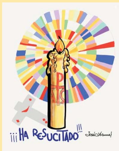
DIBUJO: Mons. Lorca Planes