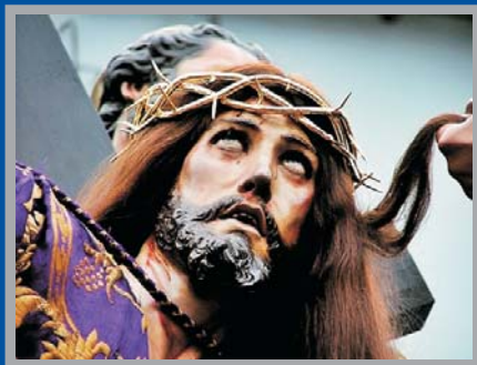
Cristo de la Caída, 1752. Francisco Salzillo Iglesia de Jesús. Murcia

Sin lugar a dudas nos encontramos ante uno de los rostros de Cristo más bellos de la producción salzillesca y de la escultura barroca, que concentra todo el dramatismo de esta composición procesional. La mirada de Cristo, verdadero centro de la escena, se clava en el cielo mientras su cuerpo se desploma en la tierra. La lividez de la piel del rostro, las cejas perforadas por las espinas, los ojos mortecinos y la boca seca ponen de manifiesto el horrible tormento al que ha sido sometido Jesús, esculpido y policromado magistralmente por el insigne escultor, que a la vez ha mantenido las notas de nobleza y serenidad del Hijo de Dios. La mirada nos remite a lo alto y Cristo parece interrogarse con el salmo ¿de dónde me vendrá el auxilio? Una mirada abierta a la misteriosa voluntad del Padre que ha permitido que resbale su pie y caiga al suelo, para que siempre comprendamos que tenderá sus manos para levantarnos de nuestras caídas.