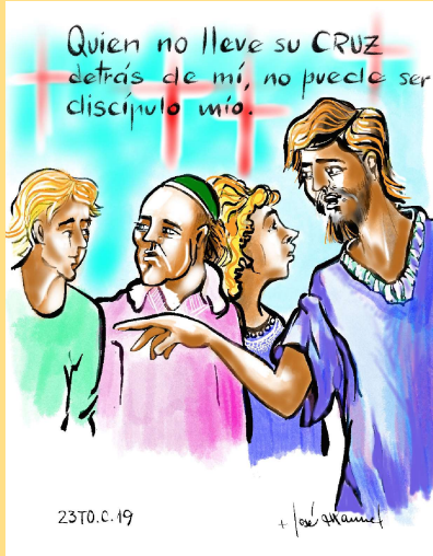
DIBUJO: Mons. Lorca Planes

«Quien no carga con su cruz y viene en pos de mí, no puede ser discípulo mío»