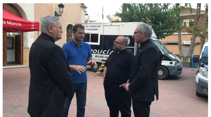
Los obispos, junto al alcalde y el párroco de El Raal