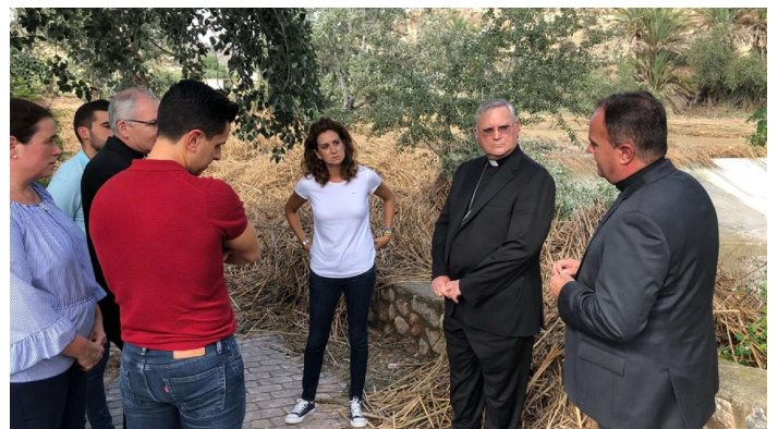
Los obispos, junto a la alcaldesa de Archena y el vicario de la zona

La última visita del domingo les llevó a la pedanía murciana de El Raal, una de las más afectadas por la gota fría, que habría celebrado el domingo la procesión de su patrona, la Virgen de los Dolores, que tuvo que suspenderse.