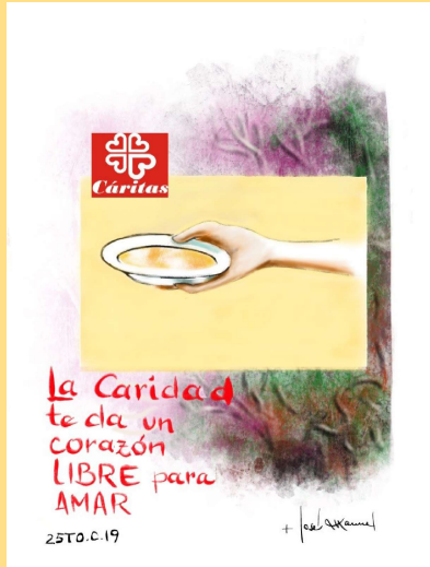
DIBUJO: Mons. Lorca Planes

«El que es fiel en lo poco, también en lo mucho es fiel»