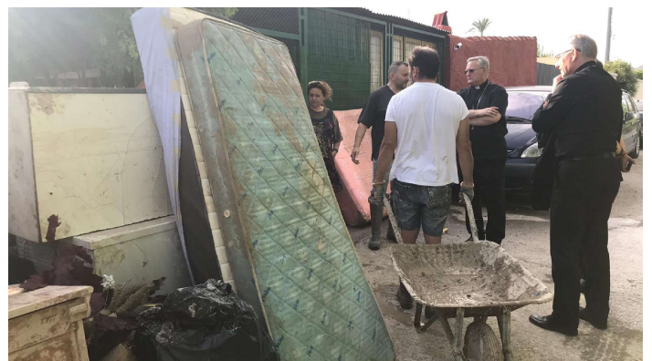
Los obispos visitaron algunas casas