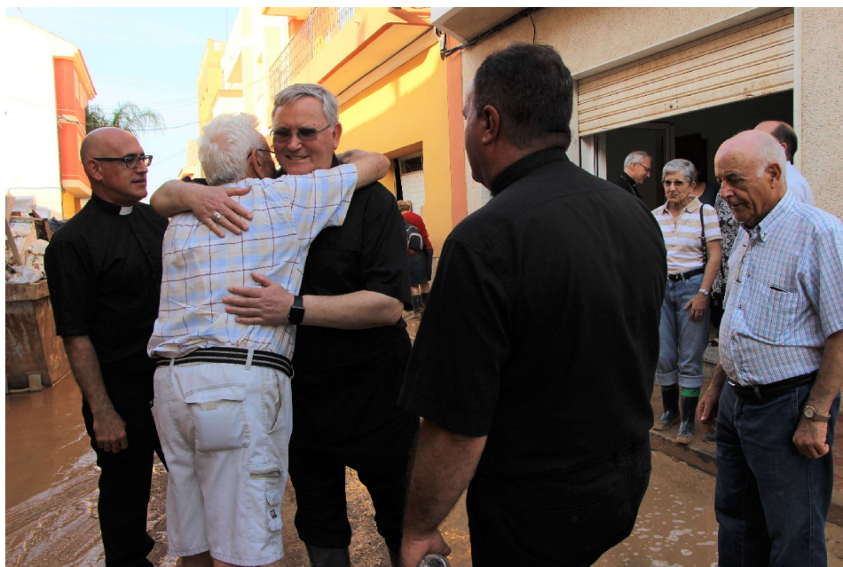
El Obispo, junto a los vecinos de Los Alcázares

Revista digital de la Diócesis de Cartagena