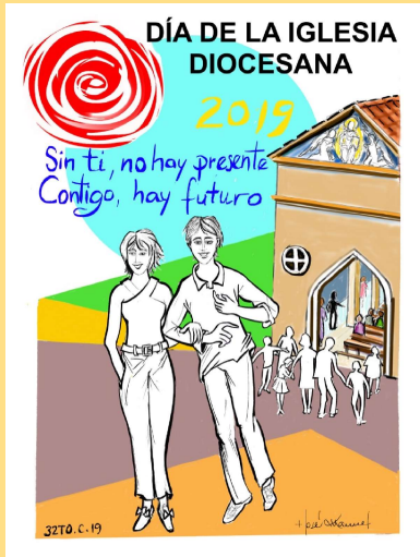
DIBUJO: Mons. Lorca Planes