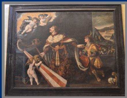
David y los tres días de peste, s.XVII. Cornelio de Beer. Colegiata de San Patricio, Lorca.

Entre las múltiples obras de arte de la Colegiata de San Patricio de Lorca se encuentra una serie de lienzos de gran tamaño del pintor holandés afincado en España Cornelio de Beer. Donados por los herederos de Juan Pérez de Meca para la capilla de San José de dicho templo, son todas ellas escenas del Antiguo Testamento pensadas como ciclo moralizante. Ejemplo de la humildad es la escena en la que el santo rey David, tras haber elegido el castigo de los tres días de peste sobre el pueblo de Israel, como lo relata el segundo libro de Samuel, pide a Dios que aplaque su ira, pues es solamente él quien había pecado mandando realizar un censo, confiando en sus fuerzas, el número de cuántos eran, en vez de poner su confianza sólo en Dios. Vestido con ropajes reales se ha desprendido de su corona y un ángel sostiene la calavera signo de la humildad, junto a la lira, atributo del rey David. Alejado en un paisaje, el pueblo sufre las consecuencias de la peste, cayendo muchos israelitas abatidos.