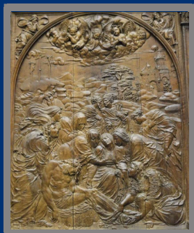
Lamentación sobre Cristo muerto, s. XVI. Sacristía, Catedral de Murcia.